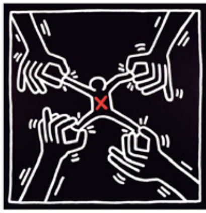
Keith Haring, Reagan Ready to Kill, 1984. Krijgsverklaring op papier, 20x15 cm. Collectie Kunsthal, Rotterdam

Tentoonstelling Keith Haring staat nu vooral bekend om zijn kunst op koffiemokken en koelkastmagneten. Maar hij was ook een actievoerende rebel. Over die politieke kant gaat zijn tentoonstelling in de Kunsthal.