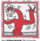
Keith Haring, Sobriety, 1984. Krijgsverklaring op papier, 20x15 cm. Collectie Kunsthal, Rotterdam

Keith Haring was een van de belangrijkste kunstenaars van de jaren tachtig. Hij was een actievoerende rebel. Over die politieke kant gaat zijn tentoonstelling in de Kunsthal.